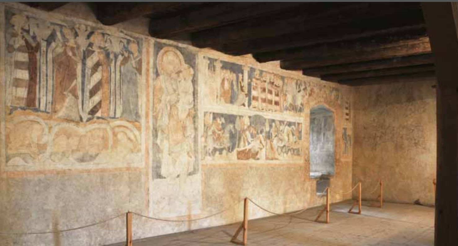
Widok na polichromie Wielkiej Sali wieży książęcej w Siedlęcinie

Poznaliśmy już szczegółowo polichromie. Dalsze informacje znajdują się na zawieszonych banerach. Pierwsze dwa z nich 6 7 skupiają się na omówieniu dawnego podziału wnętrza II piętra wieży. Możemy się z nich dowiedzieć, w którym miejscu stała pierwotnie ściana zamykająca przestrzeń Wielkiej Sali. Objasniają również znaczenie uskoków w grubości murów, które są śladami po dawnej ciepłej izbie. W ścianie wschodniej wieży zachowały się wejścia do dwóch średniowiecznych latryn, z których ta po prawej obsługiwała wspomnianą ciepłą izbę, a ta po lewej - w wydzielonym pomieszczeniu, retiradzie - przeznaczona była dla gośczonego przez księcia w Wielkiej Sali.