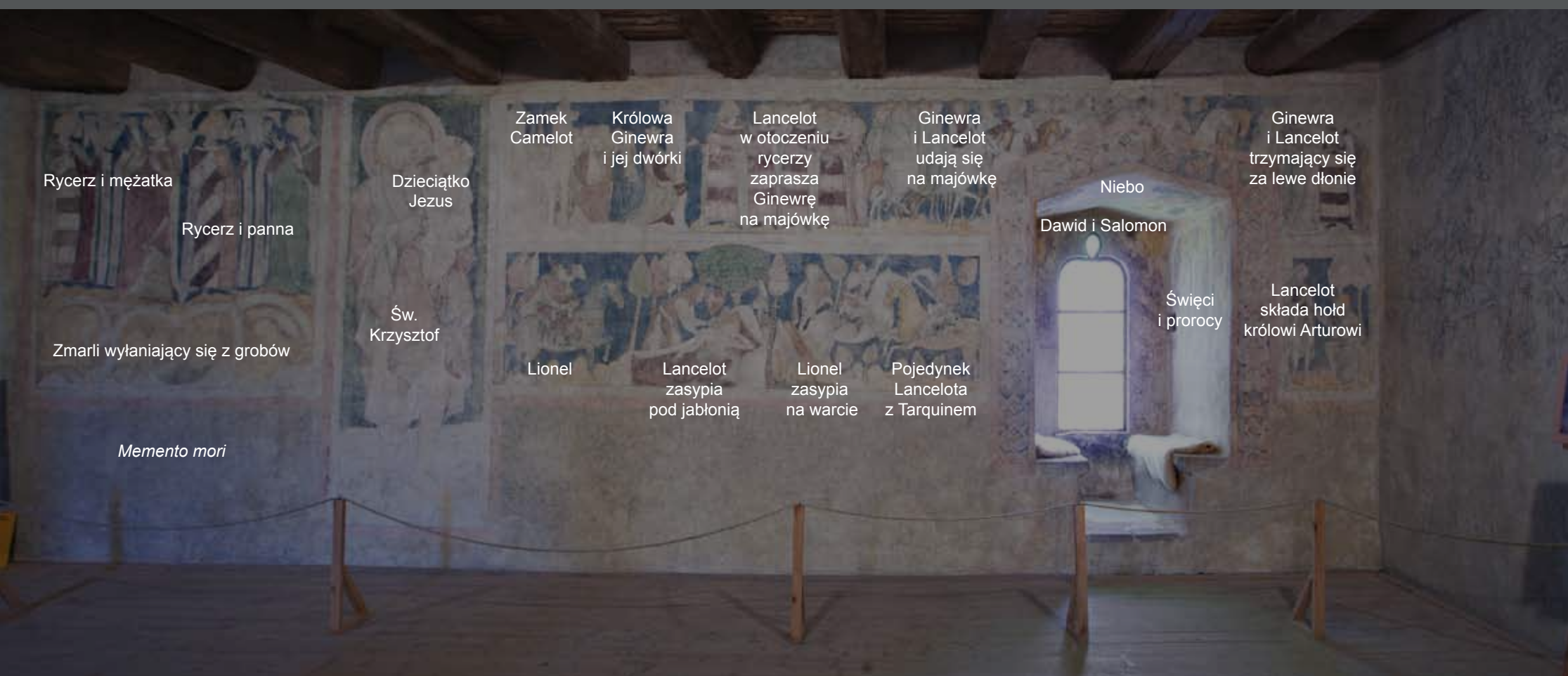
Objaśnienie scen na XIV-wiecznych polichromiach Wielkiej Sali wieży książęcej w Siedlęcinie

Kolejna tablica 5 omawia polichromie we wnęce okiennej, w której odnajdujemy postaci starotestamentowych królów, proroków i chrześcijańskich świętych oraz średniowieczne wyobrażenie Nieba. Warto spojrzeć także na sąsiednią ścianę zachodnią, na której zachowały się nieukończone szkice, ukazujące kolejne epizody z legendy o Lancelocie - pojedynek Lancelota z Sagramurem, któremu przyglądają się Iwajn, Gawain i Hektor, oraz uzdrowienie Urry'ego de Hongre.