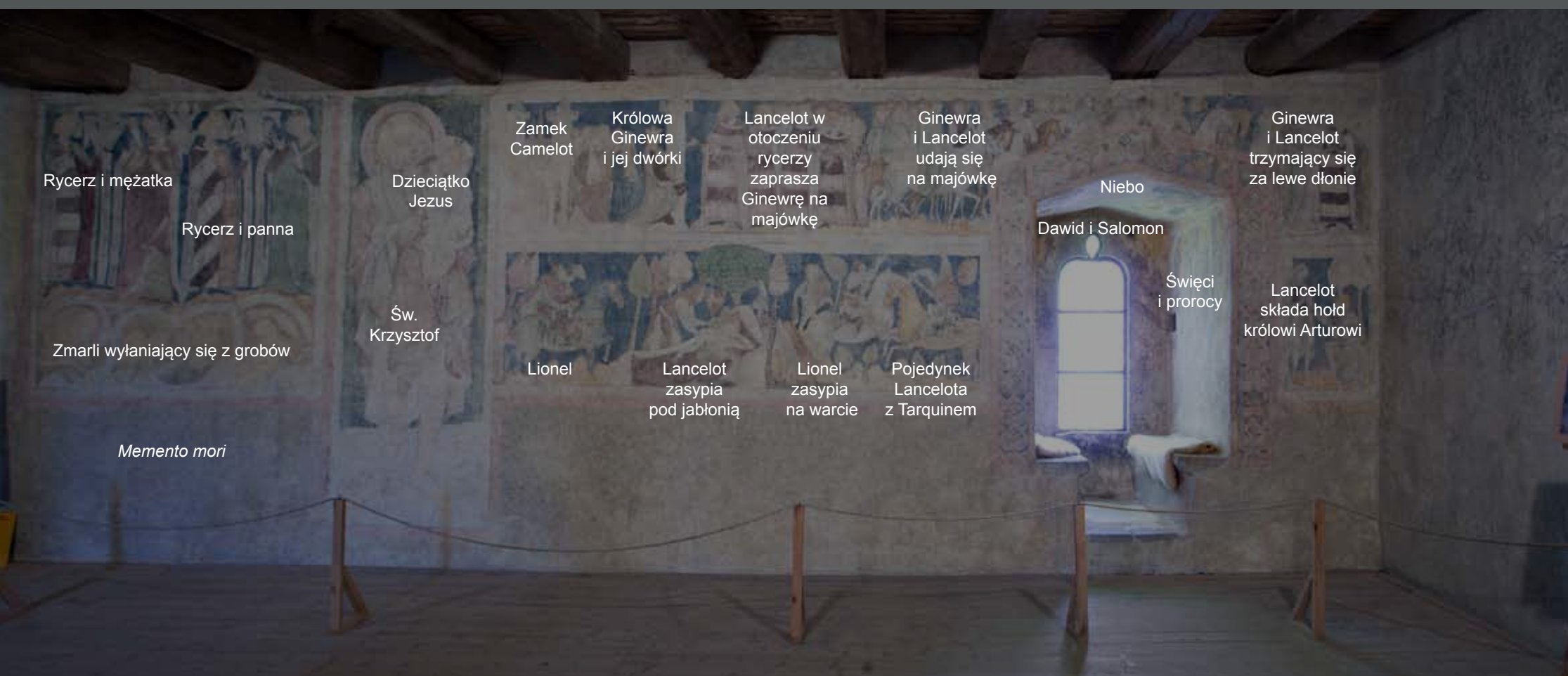
Objaśnienie scen na XIV-wiecznych polichromiach Wielkiej Sali wieży książęcej w Siedlęcinie

Przejdźmy teraz do malowideł na lewo od znanego już nam św. Krzysztofa. Zlokalizowana tam tablica 5 wyjaśni nam znaczenie przedstawienia dwóch par – rycerza i mężatki oraz rycerza i panny, a także czwórki zmarłych – wyłaniających się z grobów – którzy przestrzegają ukazanych powyżej żywych przed konsekwencjami ich wyborów. To kompozycja doskonale realizująca popularny w średniowiecznej sztuce motyw Memento mori .