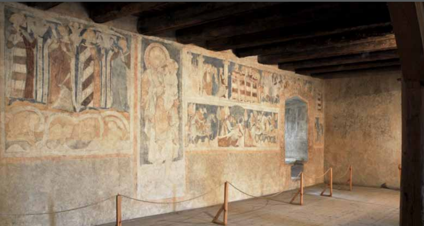
Widok na polichromie Wielkiej Sali wieży książęcej w Siedlęcinie

Poznaliśmy już szczegółowo polichromie. Dalsze informacje znajdują się na zawieszonych banerach. Pierwszy z nich 6 omawia fenomen legend arturiańskich i stara się wyjaśnić, jaką drogą i kiedy pojawiły się one w tej części Europy oraz czy ich znajomość była powszechna na dolnośląskich zamkach i dworach.