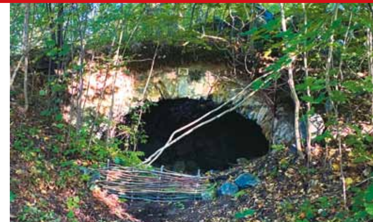
Piwnica nieistniejącego już dziś budynku na zamku dolnym

Wchodząc na wyznaczoną po prawej stronie ścieżkę, kierujemy się na oczyszczony placik ponad częściowo zawaloną dawną piwnicą. Zo-