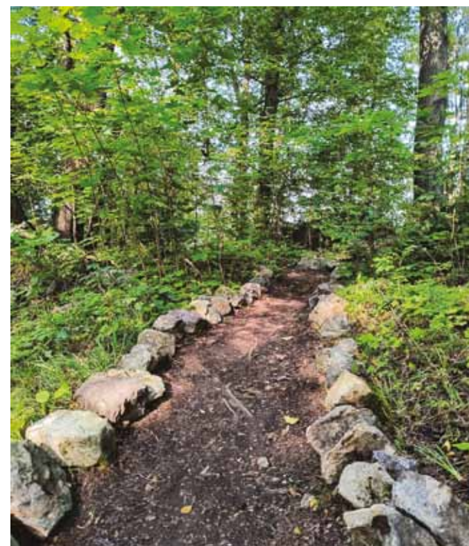
Ścieżka prowadząca od baszty łupinowej do "placyku" przy piwniczce

dować ogród apteczny/ziołowy, który zapewne zapoczątkował przyzamkowe herbularium.