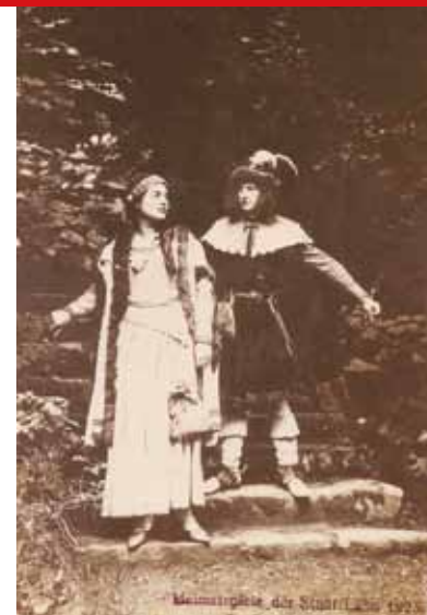
Aktorzy na schodkach do baszty łupinowej, pocz. XX w. (zdjęcie archiwalne)

Po przejściu kilkunastu metrów po prawej stronie możemy rozpoznać pierwsze pozostałości zamku średniego - basztę łupinową ④. Na jej szczyt prowadzą piaskowcowe schody. Basztę, zbudowaną zapewne pod koniec średniowiecza, zwieńczono w XX wieku piaskowcową balustradą, a w jej wnętrzu umieszczono okrągły kamienny stół z siedmioma siedziskami, przypominającymi swoim kształtem grzyby. Stąd dawna nazwa miejsca - „Siedem Grzybków”. Z tego elementu zachował się w tym miejscu do dziś tylko kamienny słupek będący dawniej podstawą stołu. W otoczeniu tego miejsca odpoczynku miał się znaj-