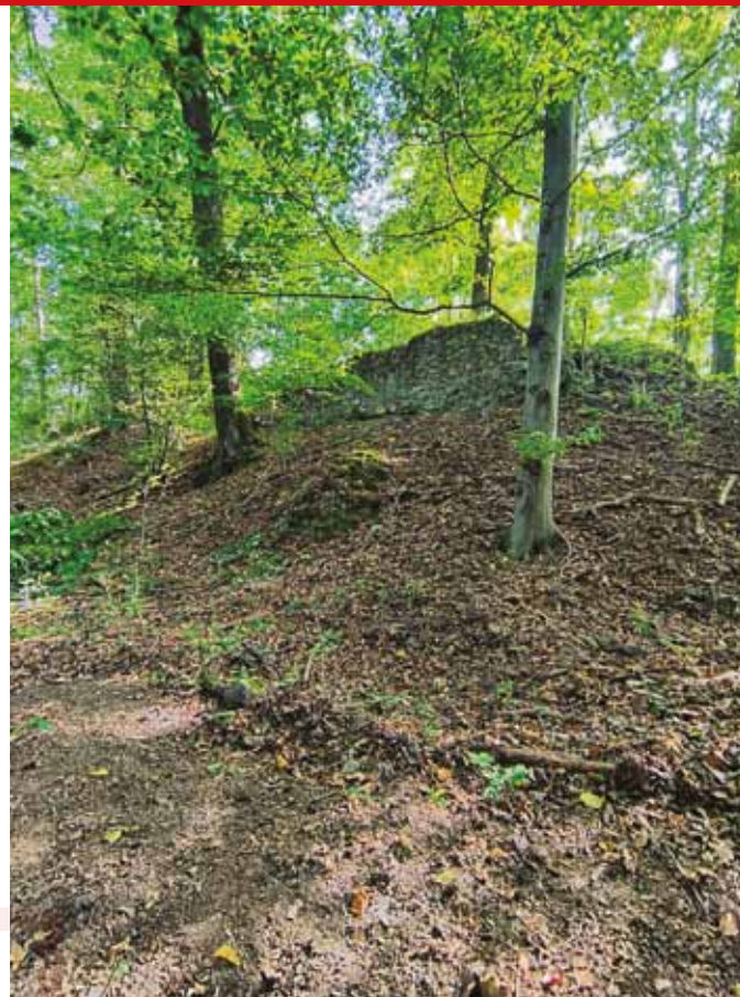
Sucha fosa i fragment murów zamku dolnego

stety nie znamy funkcji budynku stojącego dawniej na zamku dolnym, którego pozostałością jest właśnie ta piwnica.