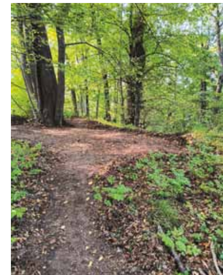
"Placyk" przy piwniczce na zamku dolnym

stawiamy placik za sobą i kierujemy się w prawo - w stronę widocznego za drzewami zamku górnego - możemy zobaczyć tu pozostałości kamiennego muru obronnego zamku średniego ⑤. Następnie zawracamy i podążamy ścieżką na wprost (mijając zawaloną piwnicę po naszej lewej), wzdłuż kolejnego muru - stanowiącego fragment wschodniego obwodu zamku dolnego. Skręcając lekko w lewo, dochodzimy do szerokiej ścieżki, z której - ostro w lewo - schodzimy trzema stopniami. Z tego miejsca możemy zobaczyć zachowaną część znanej nam już zawalonej piwnicy ⑥ (widoczne jest sklepienie kolebkowe). Nie-