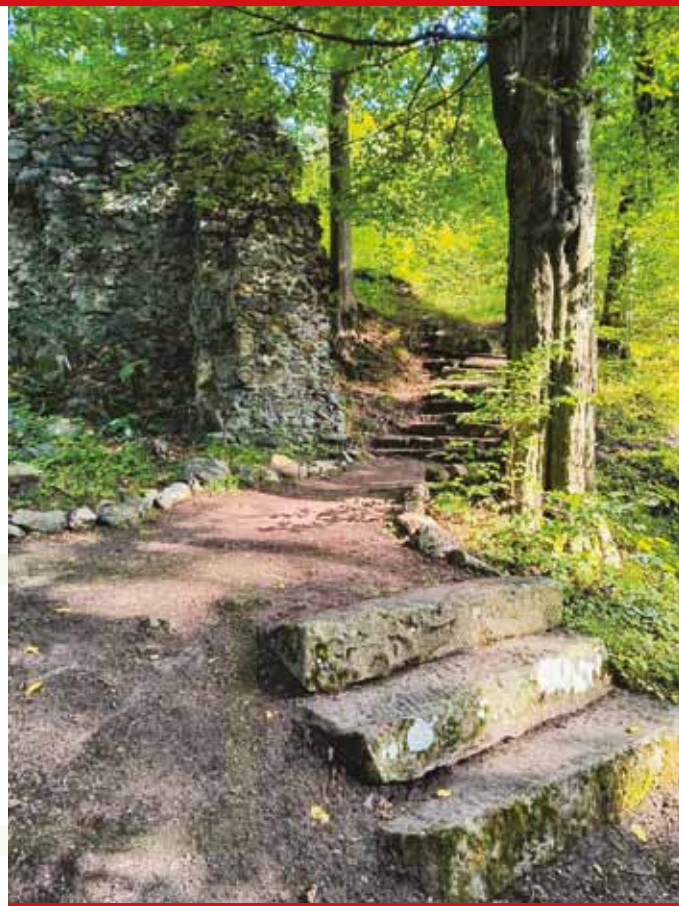
Baszta łupinowa zamku średniego wraz ze schodkami - miejsce spektakli teatralnych na początku XX wieku

Po przejściu kilkunastu metrów po prawej stronie możemy rozpoznać pierwsze pozostałości zamku średniego - basztę łupinową ④. Na jej szczyt prowadzą piaskowcowe schody. Basztę, zbudowaną zapewne pod koniec średniowiecza, zwieńczono w XX wieku piaskowcową balustradą, a w jej wnętrzu umieszczono okrągły kamienny stół z siedmioma siedziskami, przypominającymi swoim kształtem grzyby. Stąd dawna nazwa miejsca - „Siedem Grzybków”. Z tego elementu zachował się w tym miejscu do dziś tylko kamienny słupek będący dawniej podstawą stołu. W otoczeniu tego miejsca odpoczynku miał się znaj-