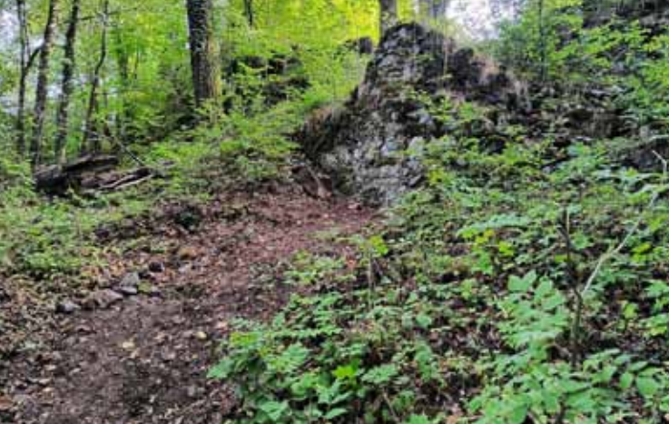
Fragment murów zamku średniego